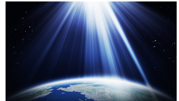
Waak alstublieft over de heiligheid van deze brochure.

Een groot leider van onze generatie zei dat het wel degelijk een verschil maakt om een Rechtvaardige niet-Jood te zijn. De Rebbe, Rabijn Menachem M. Schneerson, vertelde de wereld dat wij spoedig de komst van de rechtvaardige verlosser Moshiach (de Messias afstammend van Koning David) zullen meemaken zoals beloofd in Deuteronomium en de boeken van de Profeten. Hij drong er bij alle mensen op aan zich voor te bereiden door zich te sterken in het naleven van hun geboden. Voor niet-Joden zijn dit de 7 geboden die voor hen van toepassing zijn: de 7 Wetten die aan Noach zijn gegeven voor al zijn nazaten. Voor Joden zijn dat de geboden die voor hen van toepassing zijn. Beide sets van geboden zijn terug te vinden in de Torah en de Joodse Mondelinge Overdracht die door G-d is gegeven aan Moses op de Berg Sinaï. De G-ddelijke beloningen voor het naleven van de 7 Wetten, het leren van hun details en het aanmoedigen van hun acceptatie, zijn een erfenis voor alle niet-Joden. Deze vooruitgang zal geboekt worden door alle Joden en niet-Joden die samenwerken langs deze twee paden, in de geest van vriendelijkheid en goedheid.